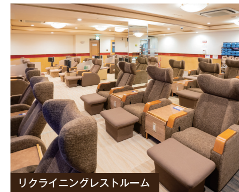
リクライニングレストルーム