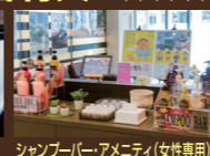
シャンプー・アメニティ(女性専用)