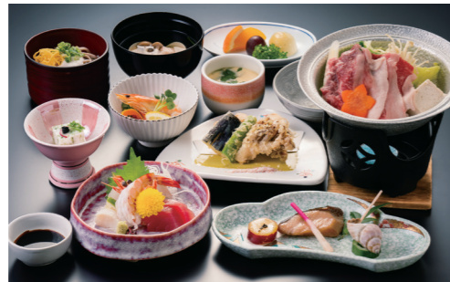
厳選黒毛和牛鍋を堪能できる会席コース