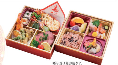
※写真は愛御膳です。