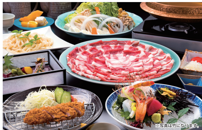
黒豚の旨味を引き出す琥珀色の出汁・タレ