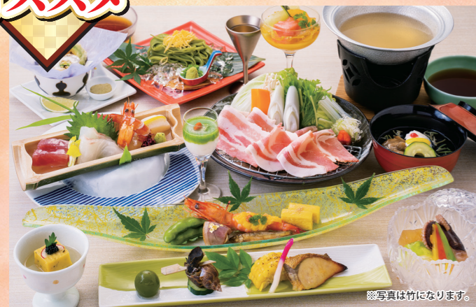
旬の食材をふんだんに使った料理長のオリジナル