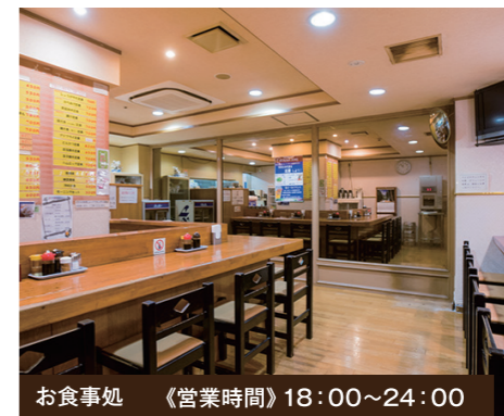
お食事処 《営業時間》18:00~24:00