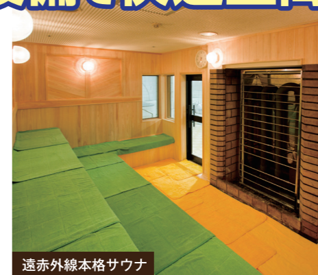
遠赤外線本格サウナ