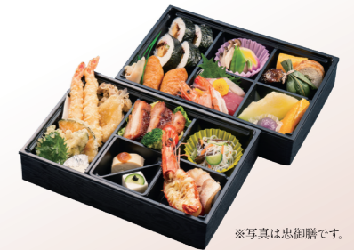
※写真は忠御膳です。

めぐみ 恵御膳 2,000円(税込) / まごころ 忠御膳 3,000円(税込)