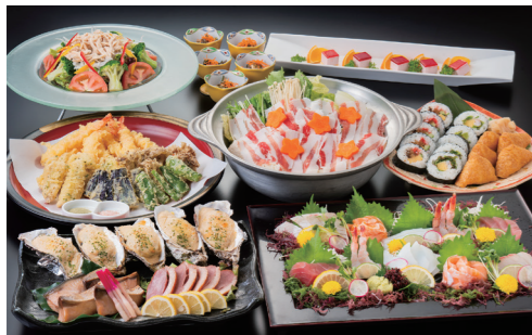
ホテルならではの、和食も洋食も同時に楽しめる卓盛コース